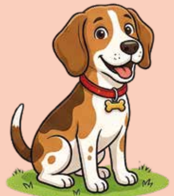
KI erstellt mit firefly.adobe.com

Immer wieder treten Beschwerden über Hundebesitzer auf, die ihre Vierbeiner vor fremden Einfahrten, Wiesen oder am Wegrand usw. ihr Geschäft verrichten lassen. Um unsere Gemeinde sauber und gepflegt zu halten, möchten wir alle Hundebesitzer dringend dazu aufrufen, den Kot ihres Hundes zu entfernen und entsprechend zu entsorgen. Als Maßnahme wurden bereits mehrere Hundekotbeutelständer in der Gemeinde aufgestellt, damit das Entsorgen der Hinterlassenschaften so einfach wie möglich ist. Wir hoffen auf die Kooperation aller, um gemeinsam für eine saubere Umgebung zu sorgen.