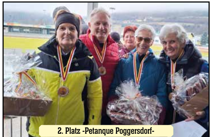
2. Platz -Petanque Poggersdorf-