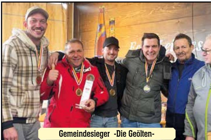
Gemeindesieger -Die Geölten-