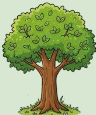
KI erstellt mit firefly.adobe.com