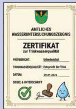
KI erstellt mit firefly.adobe.com

Das Wasseruntersuchungszeugnis ist ein wichtiges Dokument, das die Ergebnisse von Untersuchungen und Analysen des Trinkwassers zusammenfasst. Es bietet wichtige Informationen über die Qualität und Reinheit des Wassers, welches von den Bürgern einer Gemeinde konsumiert wird. Es liefert Daten zu verschiedenen Parametern wie pH-Wert, Trübung, Keimbelastung, chemischen Verunreinigungen, Schwermetallen und der Wasserhärte. Diese Untersuchungen werden regelmäßig von zuständigen Behörden durchgeführt, um sicherzustellen, dass das Trinkwasser den geltenden gesundheitsbezogenen Standards und Richtlinien entspricht und keine gesundheitlichen Risiken für die Verbraucher darstellt. Sie finden das aktuelle Untersuchungsergebnis auch auf unserer Gemeindehomepage unter: https://gemeinde-poggersdorf.at/buergerservice/abfallwirtschaft