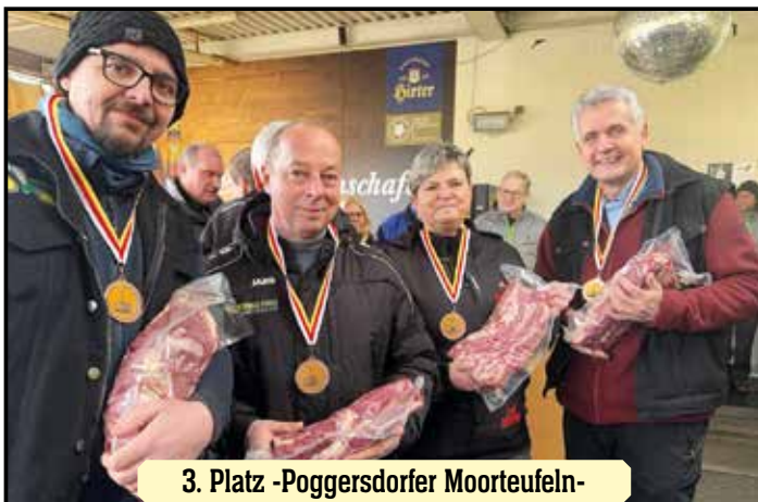
3. Platz -Poggersdorfer Moorteufeln-