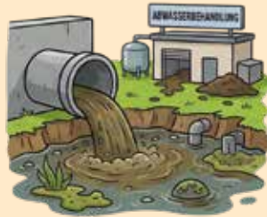
KI erstellt mit firefly.adobe.com

Es wird an die Eigenverantwortung jedes Einzelnen appelliert, damit gemeinsam eine saubere und effiziente Abwasserentsorgung gewährleistet werden kann. Vielen Dank für Ihre Unterstützung und Kooperation!